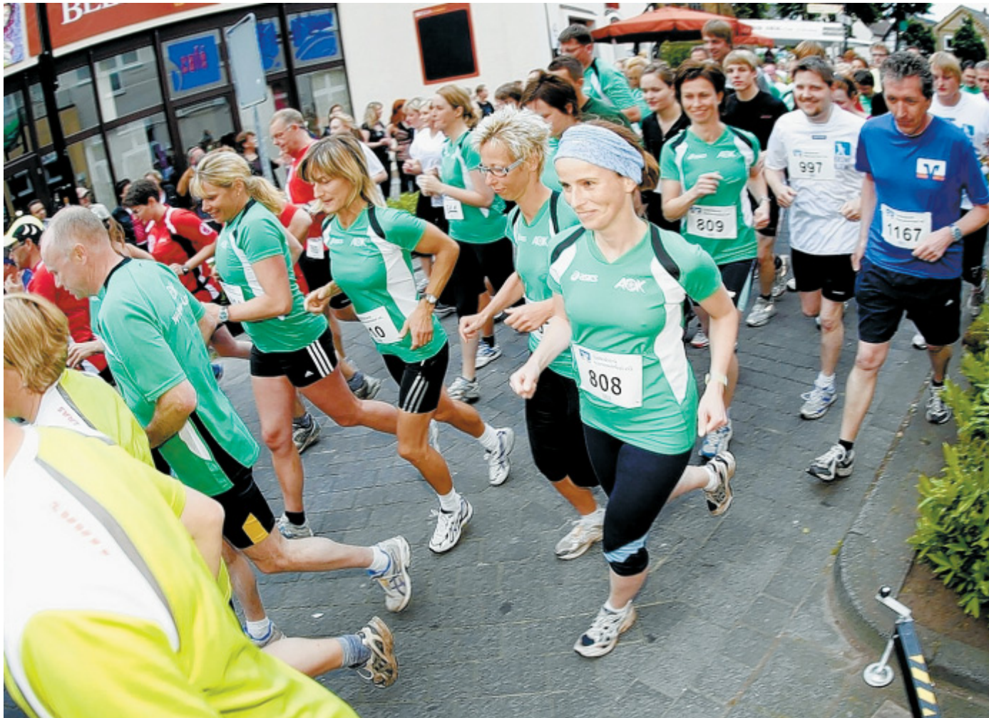
Startklar: Nachdem Eis und Schnee das Wintertraining behinderten, streben die Läuferinnen und Läufer nun mit Macht auf ihre gewohnten Strecken. Am 22. Mai findet in der Harsewinkler City (Bild) wieder der Nightrun statt.

Sportlererhebung am 17. März Rietberg. Stadt und Stadtverband ehren die Teilnehmer an der Sportabzeichenaktion 2009 und die im Vorjahr besonders erfolgreichen Sportlerinnen und Sportler im Rahmen einer Feierstunde am Mittwoch, 17. März im Ratsaal des Alten Gymnasiums. Beginn ist um 18 Uhr.